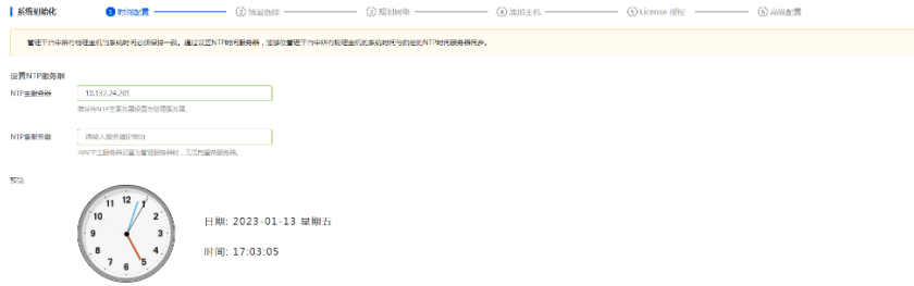
图6-1 Space Console系统初始化引导流程 - 时间配置

而现场首次登录，却直接进入管理平台页面，提示404。点击“数据中心-虚拟化”页签，弹出“未选择合法场景”后再次返回登录页面