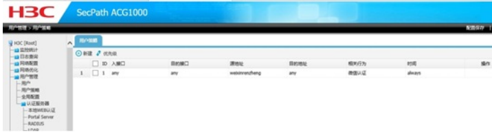
图四 ACG1000-M用户策略配置

查看配置，设备并没有问题，并且android手机可以正常弹出页面，通过微信认证。