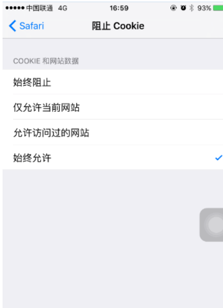
图五 iphone手机上的设置

苹果手机使用自带浏览器在AC设备或ACG设备上做portal认证也经常会遇到这种无法自动弹出页面的问题，解决方法同上。