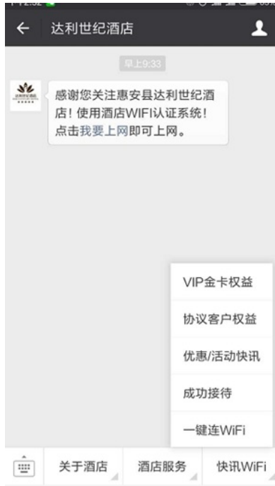
图一：微信认证界面

厦门某集团客户用ACG1000-M做微信认证，但苹果手机终端用自带的浏览器登陆无法弹出认证页面 测试过程：首先连接到要认证的WIFI，然后打开微信，点击我要上网，页面无法跳转过去