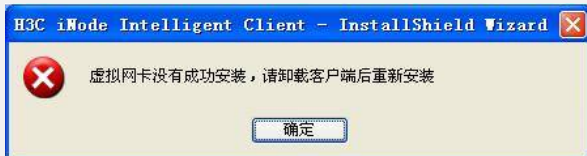
图2 安装虚拟网卡失败界面

1 如果安装程序弹出图2所示的界面说明虚拟网卡安装失败, 用户必须卸载掉客户端重新安装。