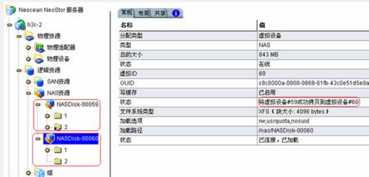
图1 NAS资源的快照拷贝

如图1中, NAS资源“NASDISK-00059”是源资源,“NASDISK-00060”是“NASDISK-00059”的目标资源, NAS资源“NASDISK-00059”中文件夹2设置了文件共享,在其快照拷贝“NASDISK-00060”中文件夹2的共享属性丢失。