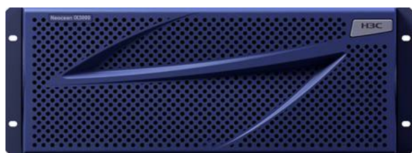
IX3040存储控制器前视图

IX3040存储产品整机包括存储控制器、磁盘框、可热插拔电源模块和可热插拔磁盘。